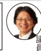
たてやま清隆 議員

●とき 毎週月曜日午後1時より ●ところ 市役所日本共産党控室（別館3階） 電話 216-1440 FAX 225-5607