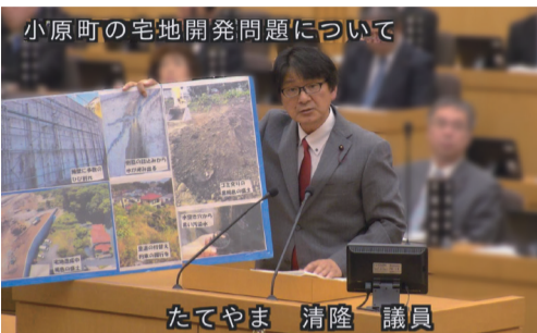
小原町の宅地開発問題について

日本共産党控室(市役所西別館3F) 電話.099-216-1440 FAX.099-225-5607