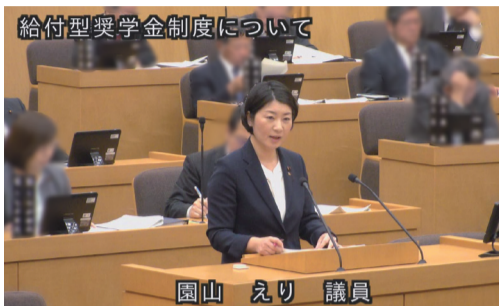
給付型奨学金制度について