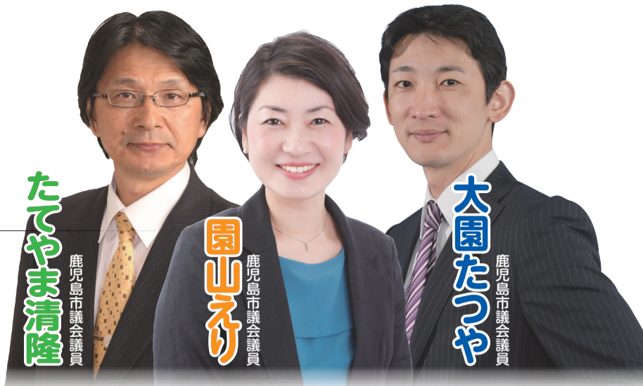
たてやま清隆 鹿児島市議会議長