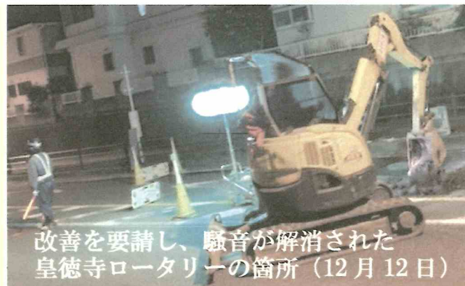
改善を要請し、騒音が解消された皇徳寺ロータリーの箇所 (12月12日)

マンホール蓋が騒音原因 皆さまのご近所で 同じような問題箇所は ありませんか？→