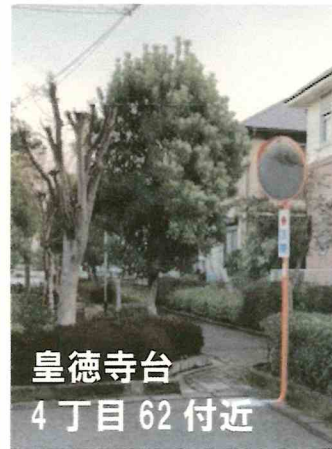
皇徳寺台 4丁目62付近