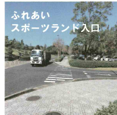
ふれあい スポーツランド入口

【回答】ふれスポ内の通路の信号機や横断歩道等の設置については、交通量の調査等を今後実施し、その必要性を検討します。