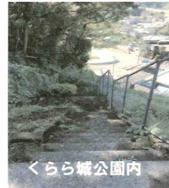
くらはら城公園内

【回答】皇徳寺くらはら城公園内の草刈りを定期的実施する。階段の手すりの設置は、施工距離が長いので、年次的に設置します。